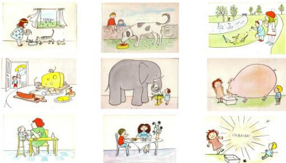
Priemonės paveikslėlių turinys.