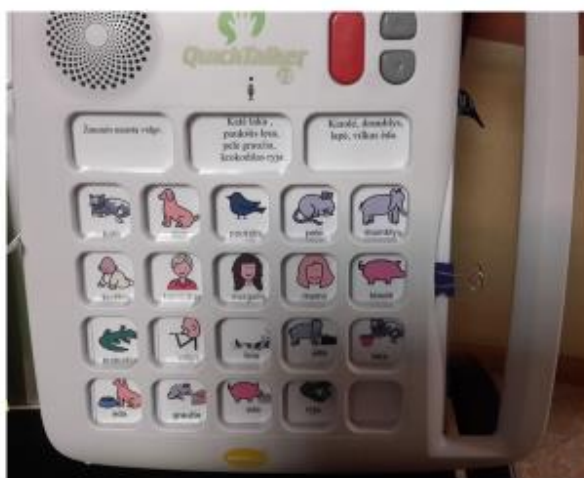
Lentelė „Kas kaip maitinasi komunikatoriui QuickTalter